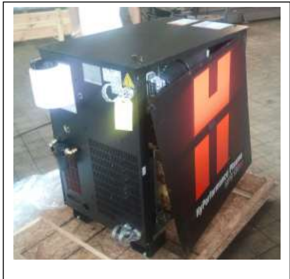
Hypertherm plazma áramforrás. (Minden benne van)