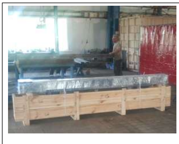
Pálya elemei és alapozó lemezek