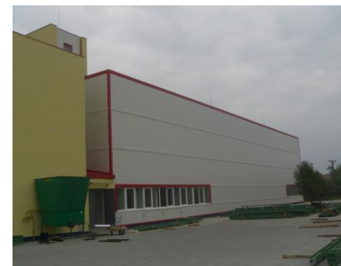
Tervezett K+F csarnok bővítés