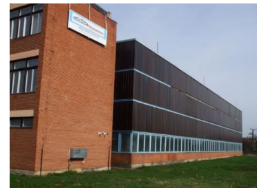
2011 Irodaépület és csarnok felújítás