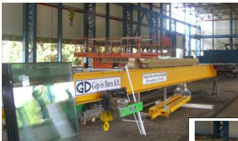
A daru leszállítása megtörtént

Az korábbi elképzeléseinkben szereplő daru ismételt versenyztetésével a kedvezőbb árú és műszaki tartalommal rendelkező GD Gép és Daru Kft. által gyártott berendezés került kiválasztásra. A szállítási szerződést 2012.04.12. kötöttük a szállítóval, amelyben a szállítási határidő 2012.06.29. Az felmerült kivitelezési problémák miatt a szállítási határidőt módosítanunk kellett. A módosított szerződésben az új határidő 2012.08.10. A statikai megerősítés végett a pályán 15/15mm oldalirányú korrekciót kellett végrehajtani. A felszerelés a megadott határidőn belül megtörtént.