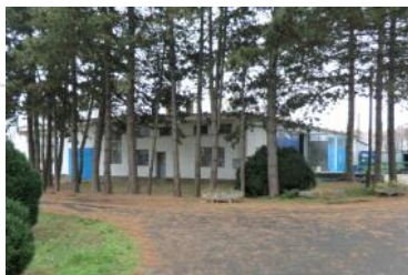
2012 K+F Zóna kialakítása