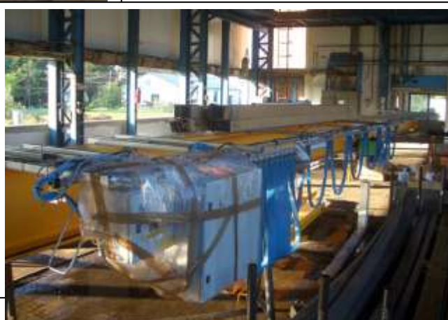
Szerelés közben (Kerékszekrény szerelés/Véghelyzetbe állítás)